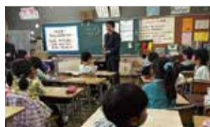
現場主義! 学校訪問