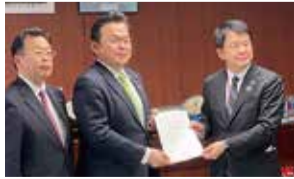
さいたま市を国へ(国土交通大臣へ要望)