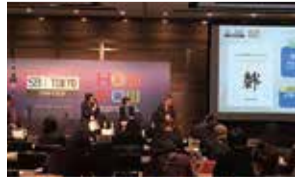
さいたま市を全国へ発信