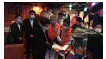
飲食店へ出向き、協力をお願いしました