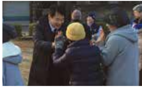
"健康"長寿のまちづくりを