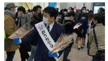
感染防止へ引き続きご協力をお願いします