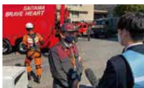
災害に強いまちをつくる