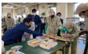
現場主義! 特別支援学校訪問