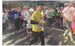
スポーツで笑顔があふれるまちに