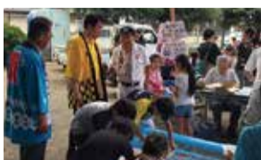
地域との絆を大切に