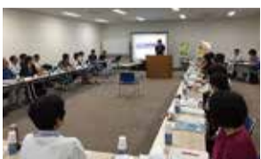
現場主義! タウンミーティング