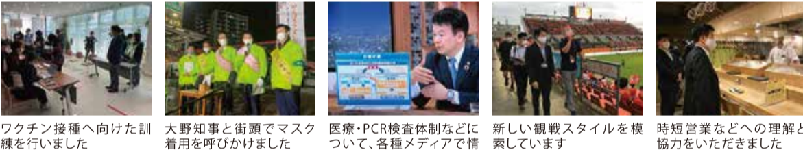
ワクチン接種に向けた訓練を行いました