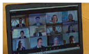
オンラインでシティセールス