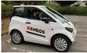
環境未来都市を目指して