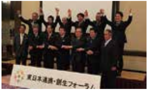
東日本連携・創生フォーラム