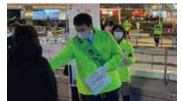
緊急事態宣言。街頭に立ち外出自粛をお願いしました

雇用の維持、経営資金の確保、新しい生活様式に対応した経済活動の支援強化、需要創出の支援強化