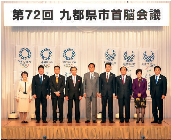
埼玉県・千葉県・東京都・神奈川県、横浜市・川崎市・千葉市・さいたま市・相模原市の市長が参加しました